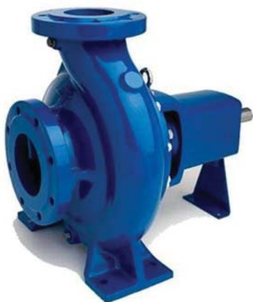
ДНУ UPM-Pump™ тип Dw / Dws (G) в сборе